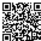
Invia richiesta di inserimento in classifica

AVVISO: Quando si invia una protesta, una richiesta o un rapporto, la procedura rimane invariata (come da Regole di Regata e Istruzioni di Regata).