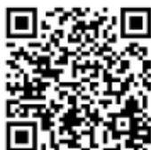
Verbali di protesta