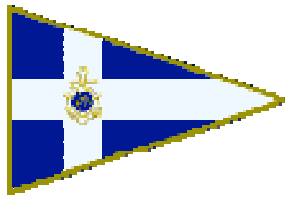
Lega Navale Italiana