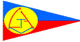
Circolo Velico Anzio Tirrena

questo momento gli accompagnatori ufficiali accreditati dovranno collaborare con i mezzi di assistenza per il recupero ed il rientro a terra dei concorrenti.