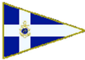
Lega Navale Italiana Sezione di Anzio